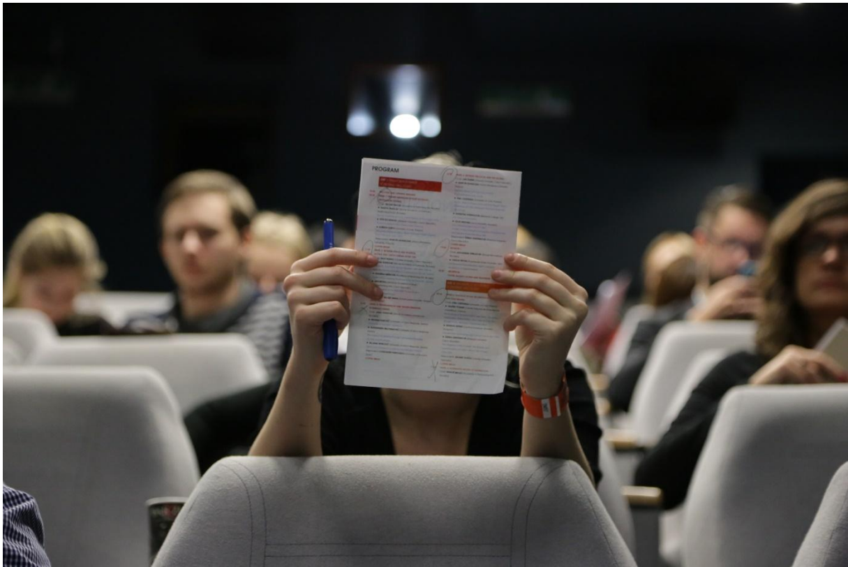
Študovanie konferenčného programu.