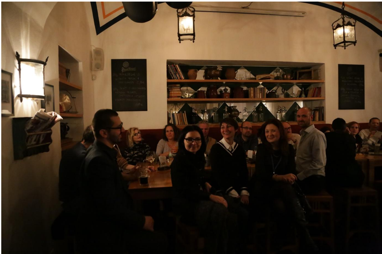
Skupinový portrét účastníkov pri posedení na záver konferencie.